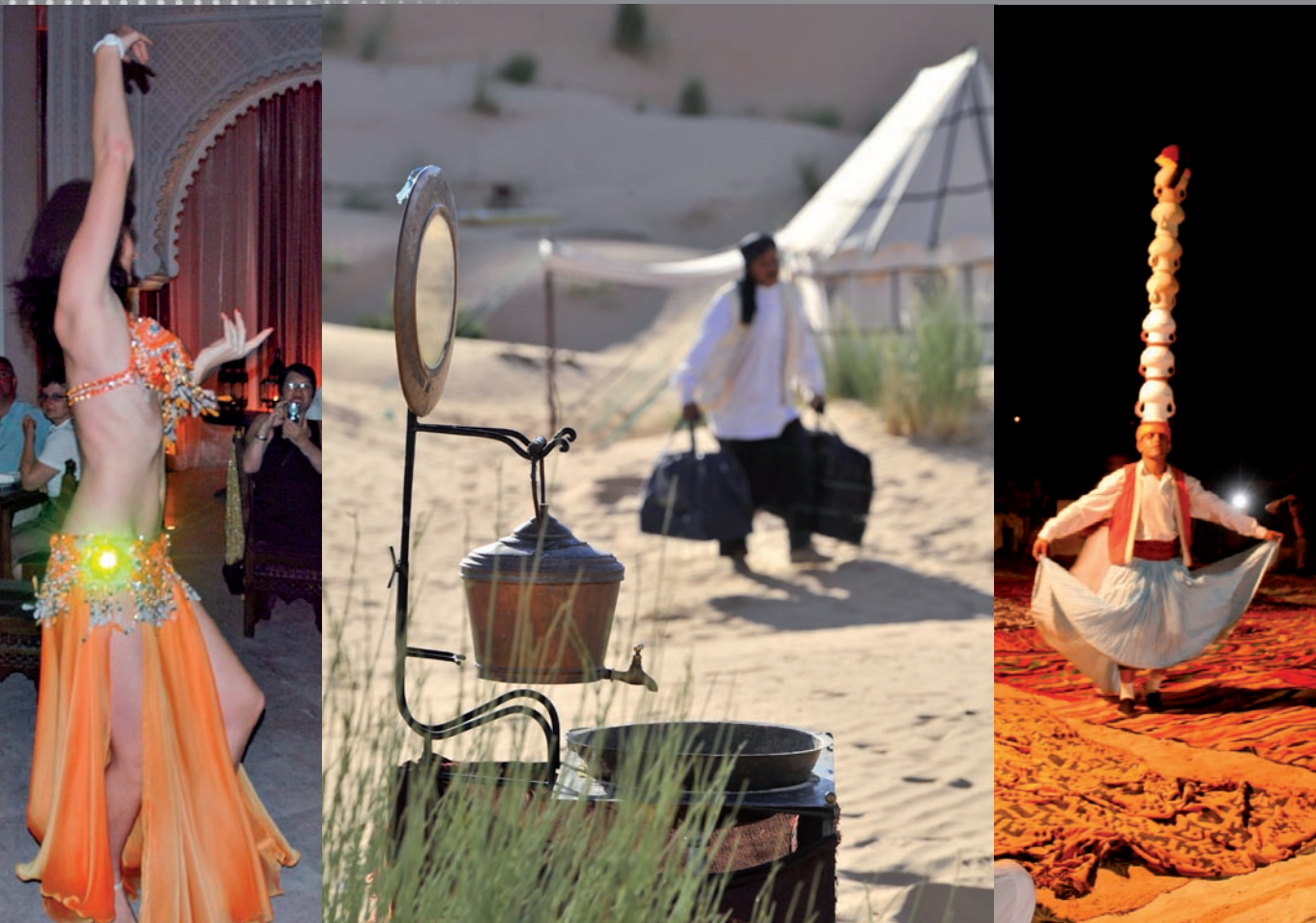
Give colors to your Incentives & Congress